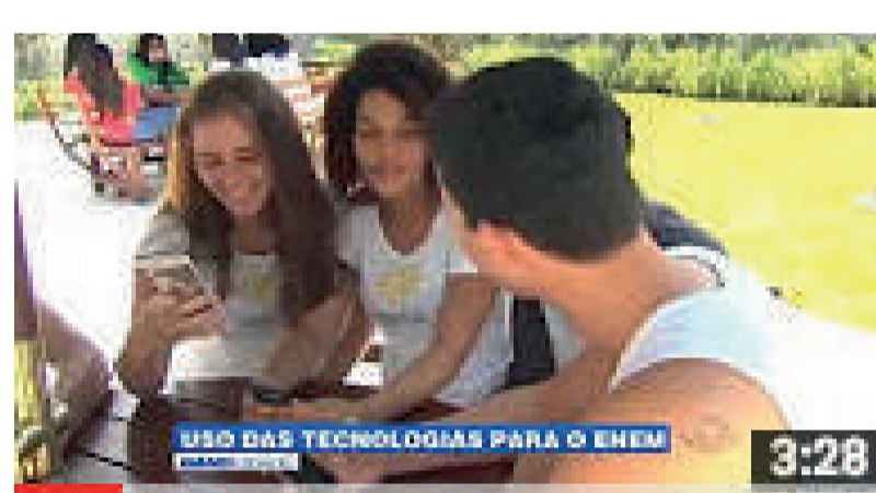
Villa na Mídia - Reportagem sobre o uso das tecnologias par... Villa Campus de Educação

Segundo SCHAFF (2014), estamos construindo uma sociedade informatizada, na era da geração digital. Esse fator tem causado um grande descompasso entre o interesse dos jovens pelos estudos e o uso excessivo das TIC's. Nesse contexto, o espaço escolar precisa se modernizar cada vez mais, promovendo o uso correto das TIC's, de maneira que sejam utilizadas em prol de uma melhor aprendizagem. Além disso, vale lembrar que há fortes evidências científicas de que as crianças e adolescentes que praticam atividades extracurriculares – jogos esportivos, oficinas de teatro, música, artes, danças, games, escritas criativas, consumo consciente etc. – apresentam um maior e mais significativo envolvimento com a escola e, conseqüentemente, melhores resultados acadêmicos (Marques, 2002, citado por Simão, 2005).